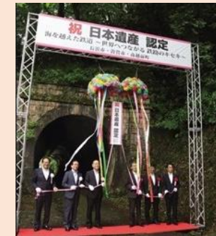
観光資源魅力発信への協力