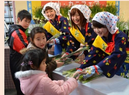
地域イベント等への協力