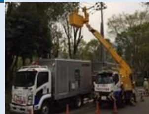
災害時の停電復旧作業