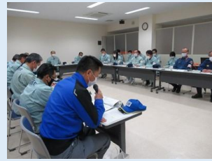
総合防災訓練への参加