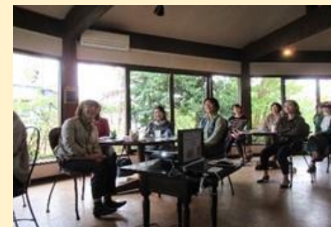
女性対象のふれあい講座