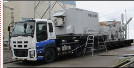
移動式変電所 外観

主変圧器の復旧までの間、志賀中能登線を活用して所内電源設備が受電できる設備を設置する。 当該設備は、常時受電せず、必要時に使用する。