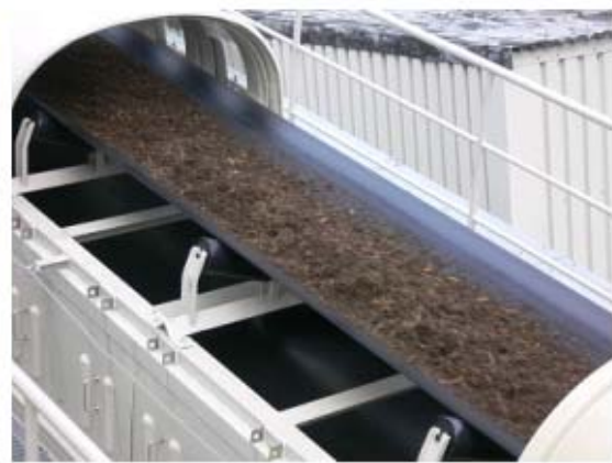
ベルトコンベヤ上の木質バイオマスチップ