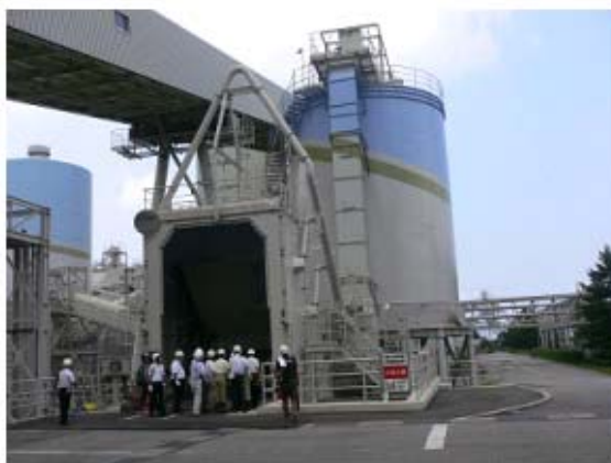
木質バイオマス混焼設備(受入ホッパ、サイロ等)