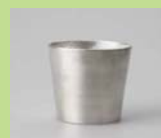
② 高岡「能作」 錫100% タンブラー