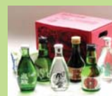
① 富山の地酒 銘酒セット