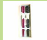
④ 「食べる」を彩る 輪島箸2膳入