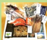
① 富山湾の海の幸 干物セット