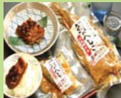
③ 人気のスローフード 鯖のへしこ