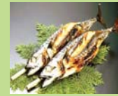
③ 福井名産 焼き鯖 詰合せ2本入