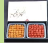
② ふるさとの味 福井梅