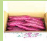
④ 加賀野菜 五郎島金時5kg