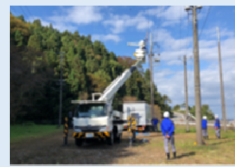
電源車による災害時の復旧作業