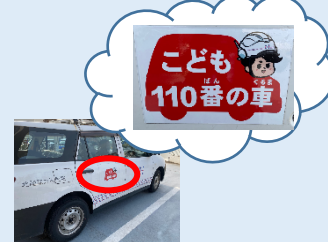
こども 110 番の車