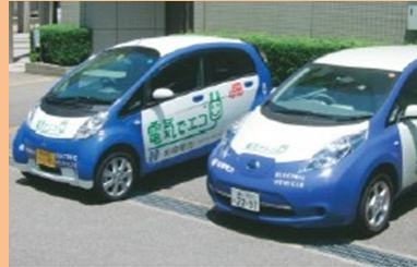
電気自動車などエコカーの導入拡大