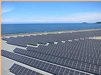
再生可能エネルギーの導入拡大