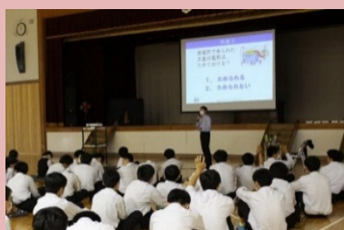
学校での出前講座の実施