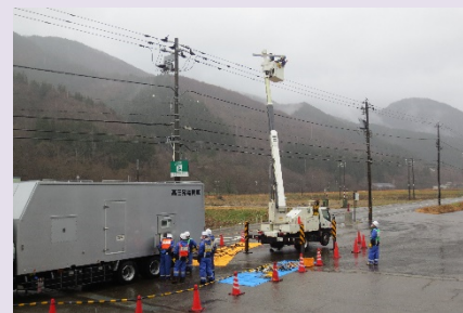
災害時における連携（迅速な復旧作業の実施）