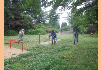
清掃活動への参加