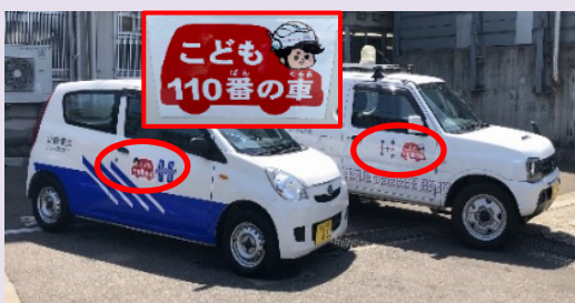
子ども110番の車（見守り活動の実施）