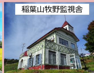
稲葉山牧野監視舎