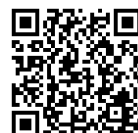
高圧・特別高圧のお客さま