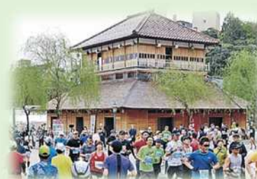
地域イベント等への協力