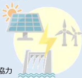
エネルギー活用への協力