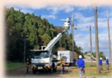
災害発生時の電源確保に関する協力