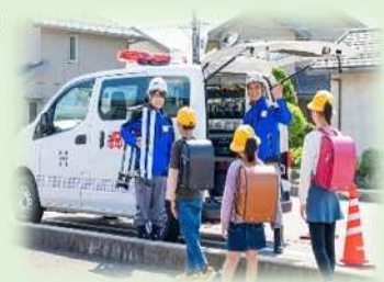
子どもや高齢者の見守り活動